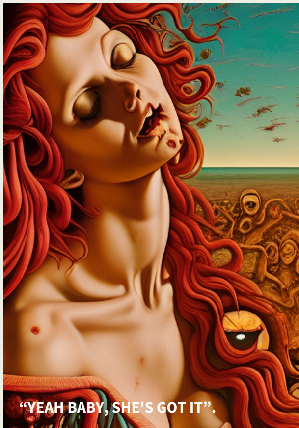
“YEAN BABY, SHE'S GOT IT”.

В то время, когда произошли события, о которых мы собираемся рассказать, Италия уже не была счастливым местом для проведения отпуска, и что-то очень тёмное сотрясало население, поедающее пасту.