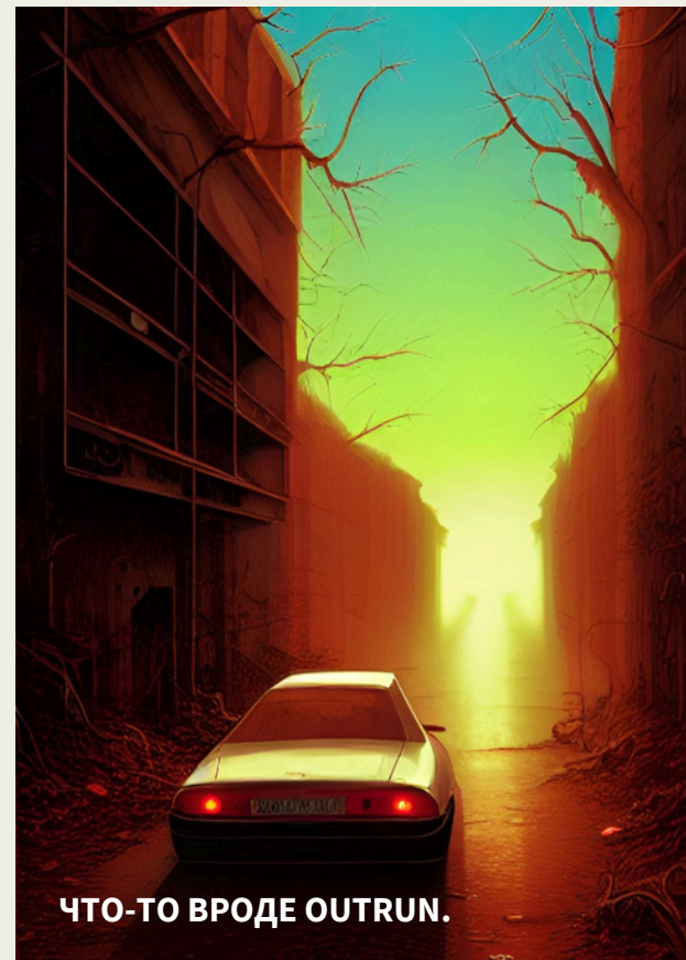
ЧТО-ТО ВРОДЕ OUTRUN.

Полуостров в форме сапога переживал один из самых глубоких и тёмных периодов экономического, санитарного и культурного упадка.