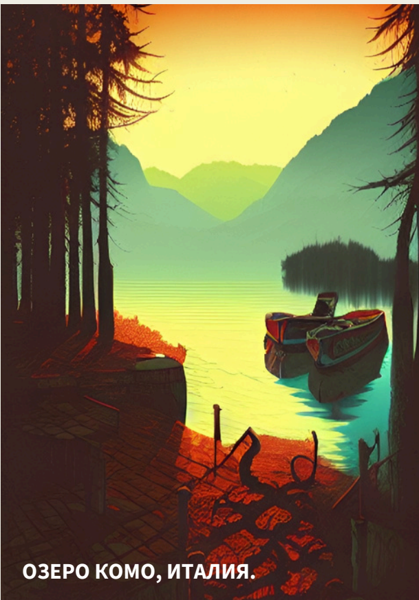
ОЗЕРО КОМО, ИТАЛИЯ.

В то время, когда произошли события, о которых мы собираемся рассказать, Италия уже не была счастливым местом для проведения отпуска, и что-то очень тёмное сотрясало население, поедающее пасту.