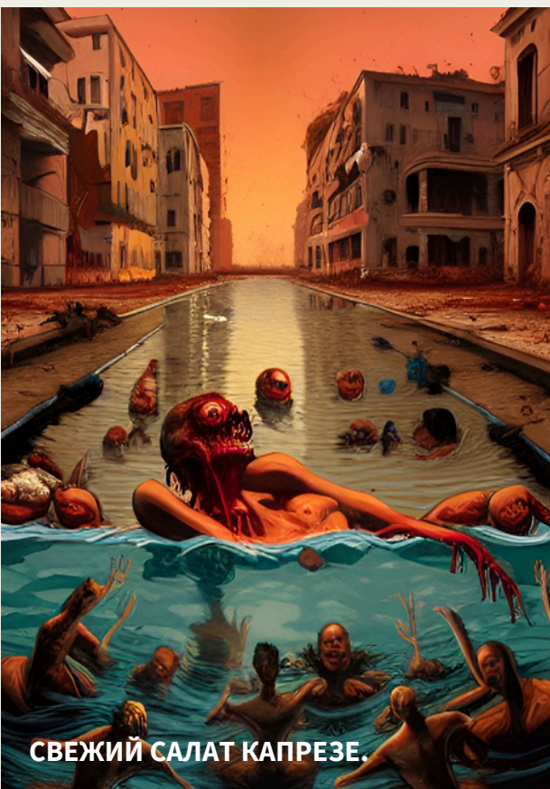
СВЕЖИЙ САЛАТ КАПРЕЗЕ.

Даже летние каникулы приняли гораздо более драматичный оборот, чем мы привыкли. Вместо того чтобы бороться за место под зонтиком в первом ряду, они боролись за кусок хлеба, спрятанный в купальнике.